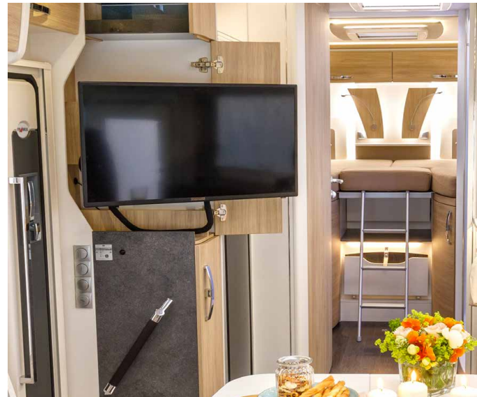
Serienausstattung: „Verstecker“ 32-Zoll-TV mit raffiniertem Auszugssystem

Auch in Sachen Stil geht der FRANKIA PLATIN FINAL SIX besondere Wege: Der Luxusliner überzeugt mit einem neuen Außendesign und einer edlen Innenraumausstattung, die es so in keinem anderen FRANKIA Wohnmobil gibt. Visby White, ein helles Holz mit dezent-harmonischer Maserung, wird mit einer Polsterung aus braunem Echtleder und Microfaser kombiniert – alles natürlich in Serie. Liebevolle Details wie das gestickte Logo auf dem Fahrer- und Beifahrersitz runden den exquisiten Gesamteindruck der limitierten Sonderedition ab.