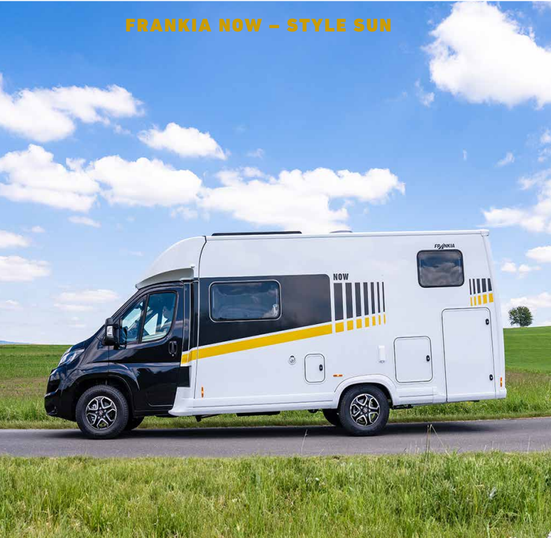
FRANKIA NOW – STYLE SUN