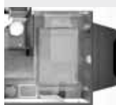
Lit pavillon (L. x l.)