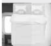
Lit pavillon (L. x l., sur les Intégraux)