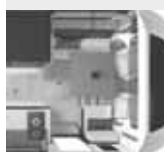
Lit pavillon (L. x l.)