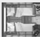
Lits arrières (L. x l.)

Lit gauche : 200 x 74/106, lit droit : 200 x 73/106cm