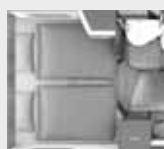
Lits arrières (L. x l.)

Lit gauche : 200 x 80, lit droit : 195 x 82 cm