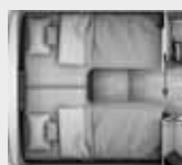
Lits arrières (L. x l.)