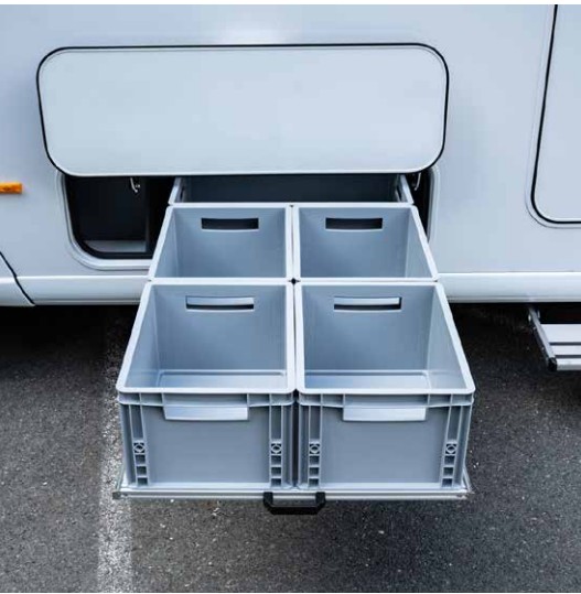
Highlight im neuen Doppelbodenkonzept: das große, durchgängige Stauraumfach mit opt. Touch-Öffnung und Auszugssystem.