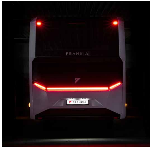
... mit seiner markanten Optik, durchgehendem BridgeLight und Highlights wie einem optionalen Panoramafenster im Heck.