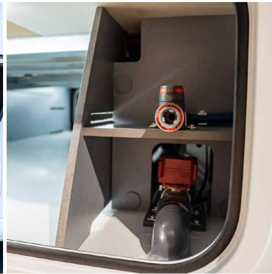
Auch die Wasserversorgung hat jetzt ihren festen Platz. Neu im NOCTRA: die Grauwasserentleerung mit elektrischem Ventil.