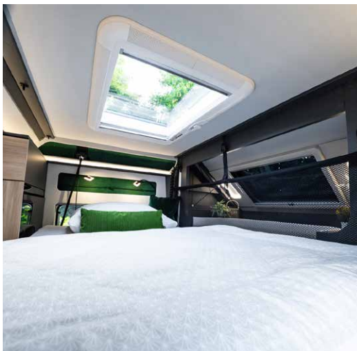
Perfekt für Familien: Die Längsbetten werden ergänzt durch ein elektrisches Hubbett, das komplett im Dach „verschwindet“.