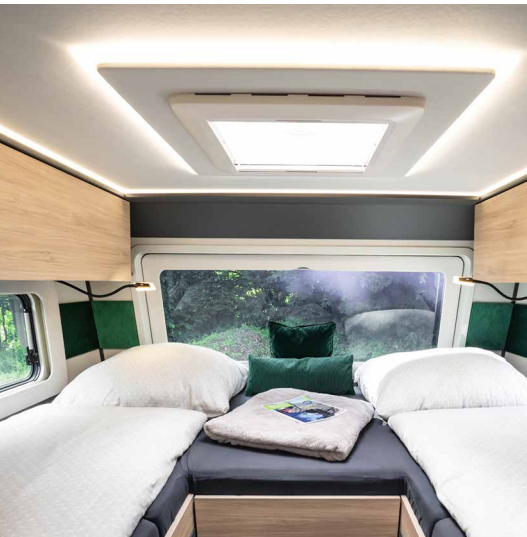
Einen einzigartigen Ausblick und Inside-Out-Feeling gewährt ein opt. Panoramafenster über den Längsbetten.