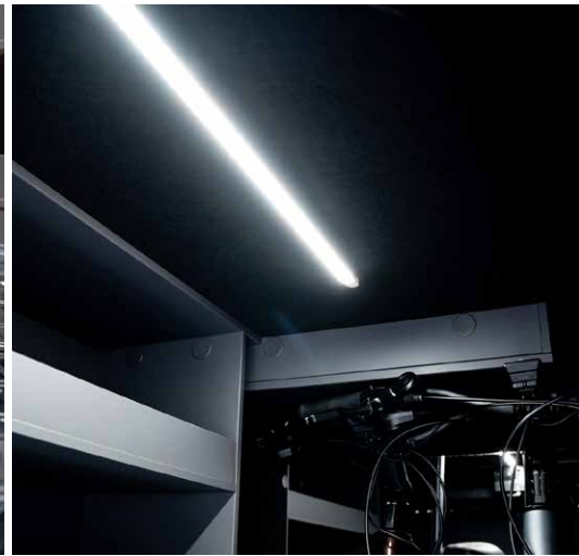
Die helle Beleuchtung in der Heckgarage macht das Be- und Entladen bei Tag und Nacht besonders einfach.

» „Next level comfort‘ ist eines der wichtigsten Themen des FRANKIA NOCTRA. Ob Raumgefühl, Stauraum, Licht – vom ‚Großen‘ bis ins kleinste Detail haben wir Lösungen neu gedacht, um das Reisen maximal komfortabel zu machen. Besonderes Komfort-Highlight ist sicher das völlig neu gedachte Doppelbodenkonzept mit riesigem Durchladefach und Auszügen. Reisende profitieren auch vom neuen Klappenkonzept, das ermöglicht, einzelne Zugänge ganz einfach ‚per Touch‘ zu öffnen. Vorhandene Griffe sind eingelassen und lassen sich mit einer Hand öffnen. All das und vieles mehr steht für das nächste Komfort-Level, das die FRANKIA-Zukunft bestimmt.“