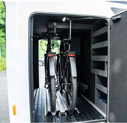
Stauraum im NOCTRA? Auch hier setzt FRANKIA auf Luxus. In Innenraum, Doppelboden und Heckgarage gibt es massig davon.