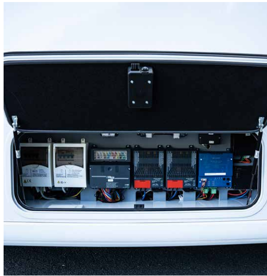
Auch die komplette NOCTRA-Technik ist jetzt übersichtlich im Doppelboden angeordnet – und natürlich ganz einfach zugänglich.