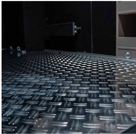
Praktisches Feature, damit alles an Ort und Stelle bleibt: Riffelboden in der Heckgarage des NOCTRA.