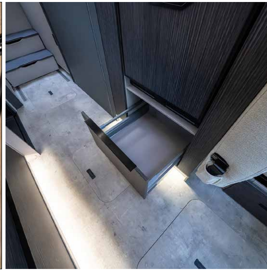
Praktischer zusätzlicher Stauraum: Unter und über dem Kühlschrank mit Gefrierfach gibt es zusätzliche Fächer.