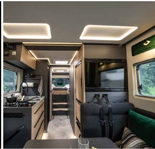
Hier spielt Größe eine große Rolle: Der Innenraum des NOCTRA überzeugt durch fantastische Weite und ein neues Design.