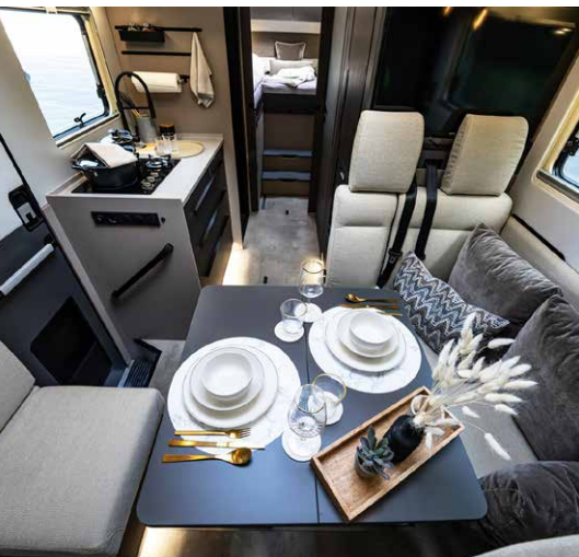
Die große Sitzgruppe gibt es wahlweise in Crème mit der Stylefarbe Dune oder in Anthrazit mit der Stylefarbe Forest.