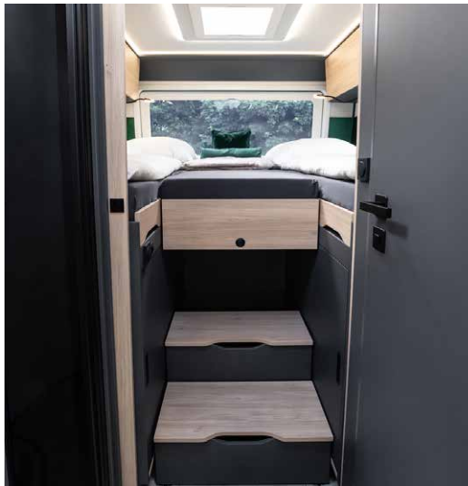
Der Einstieg in die erweiterten Längsbetten wird durch ein neu entwickeltes Stufensystem mit Schienen noch einfacher.