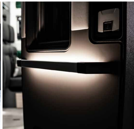
Smarte Features: beleuchteter Griff in der neuen Aufbautür sowie die Coming-Home- und Leaving-Home-Funktion.