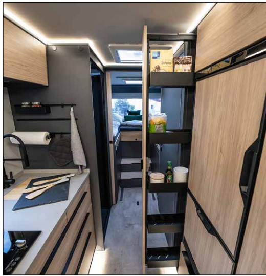
Highlight in der Küche des FRANKIA NOCTRA ist sicherlich auch der raumhohe Apothekerauszug.