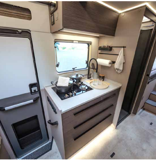
Die NOCTRA Küche setzt auf monolithisches Design – und damit auf einen sehr tiefen, großen Küchenblock mit viel Stauraum.