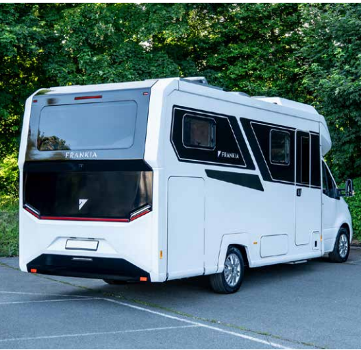
Bereits das Außendesign des NOCTRA setzt Maßstäbe: mit modernen Linien und einem ganz besonderen „Statement“-Heck ...