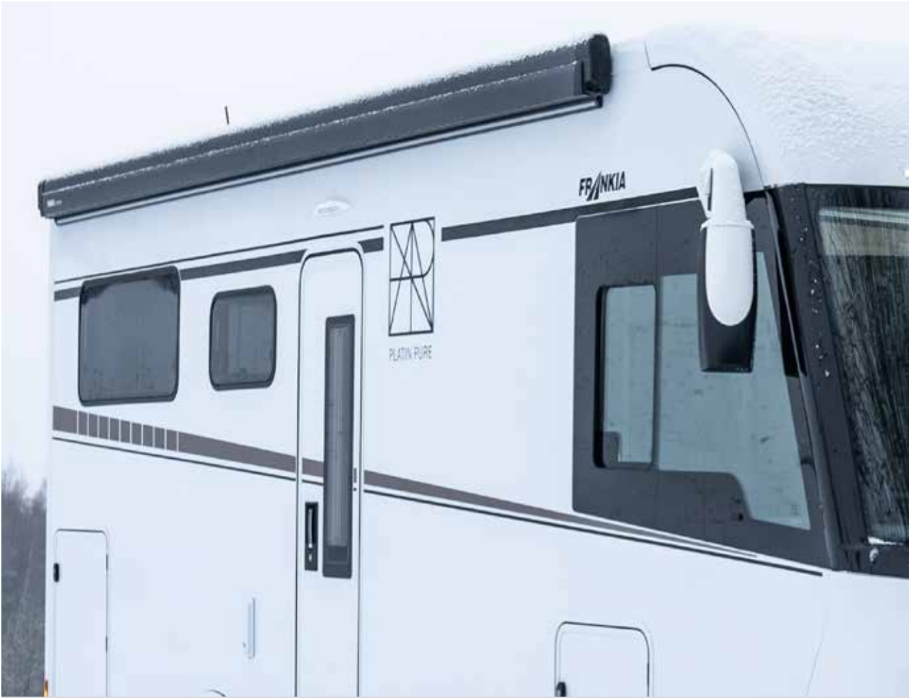
Markise - optional mit integriertem LED-Beleuchtungsprofil (Abbildung beispielhaft)