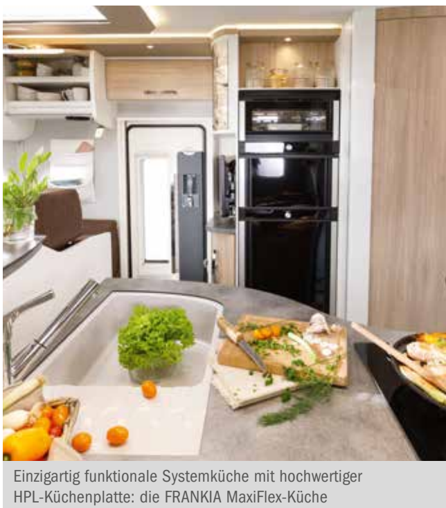
Einzigartig funktionale Systemküche mit hochwertiger HPL-Küchenplatte: die FRANKIA MaxiFlex-Küche