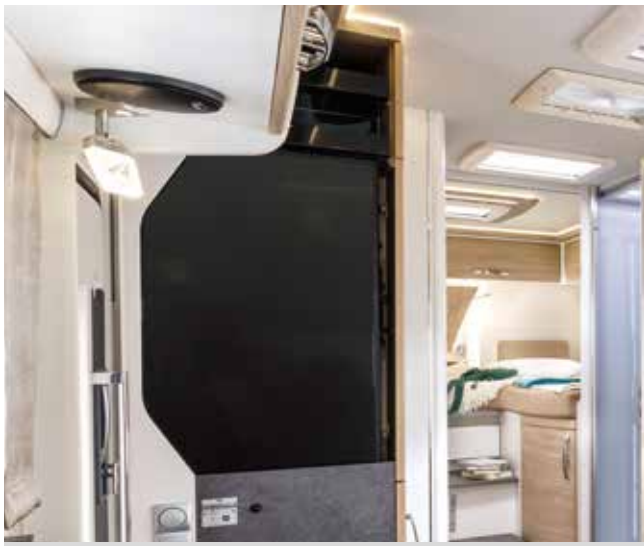
Flachbildschirm 32 Zoll (Bild beispielhaft)