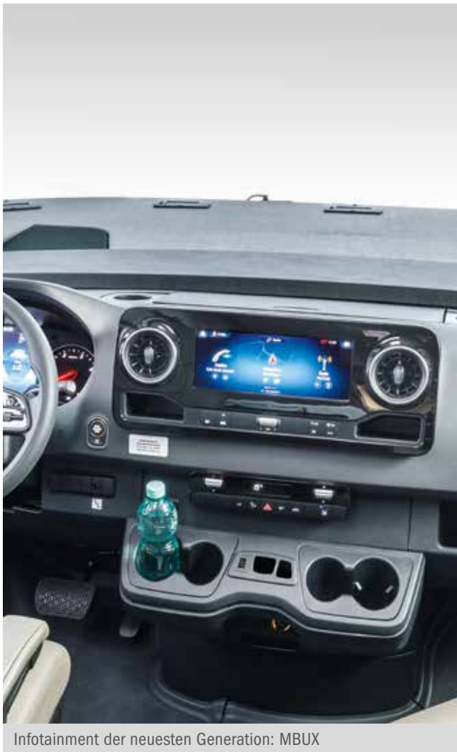
Infotainment der neuesten Generation: MBUX