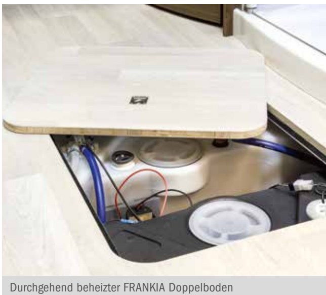
Durchgehend beheizter FRANKIA Doppelboden